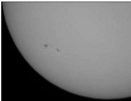
Az 1040-es számú foltcsoport Hadházi Csaba 2010. január 15-i felvételén. 200/1000 Newton, Szűrő: Baader Astrosolar, kamera: Panasonic Lumix

A december 15-én megjelenő 1035-ös csoport már sokkal több és nagyobb foltokat tartalmazott, foltjai dinamikusan fejlődtek. Szépen lehetett követni az umbra és a penumbra alakulását. December 22-én tűnt el.