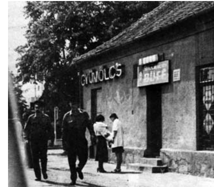
A Jószerencsét büfé 1982-ben

lagászati, 03:55-kor a navigációs, 04:33-kor a polgári szürkület kezdődött és 05:04-kor kelt a Nap.) Ezek KözEI-időpontok, mert akkor még nem volt nyári időszámítás. Péntek délután busszal bementem Pécs belvárosába. Moziban voltam. A film nem lehetett különösen emlékezetes, mert sem a címe, sem a története nem maradt meg. Korábbi években a helyi autóbuszok közvetlenül mentek a belvárosból Vasasig. Ekkoriban már csak a „Budai Vám” alközpontig mentek. Itt le kellett szállni és átszállni a vasasi buszokra. 20 óra elmúlt és a késő estében már csak 14-es autóbuszok jártak, egyik éppen az orrom előtt ment el. A mai Pécsvaradi út és Komlói út sarkán álló műintézménybe, a Jószerencsét büfébe tértem be. A talponállóban kértem egy korsó sört. Kimentem a buszmegállóba és láttam, hogy még van 20–25 percem a következő buszomig. Így – és ez sorsdöntőnek bizonyult! – visszamentem és ittam még egy sört.